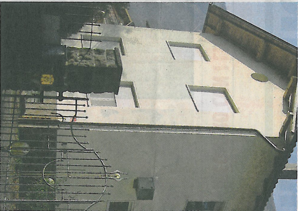
L'asilo di lingua italiana di Magré che quest'anno può contare su 17 alunni

Assieme all'amico vice sindaco di Cortina Cavaliere ci siamo battuti per ottenere il meglio della possibilità didattica. E ne siamo pienamente soddisfatti. E sono sicuro che la nostra struttura arricchirà bambini anche dai paesi limitrofi». Si tratta quindi