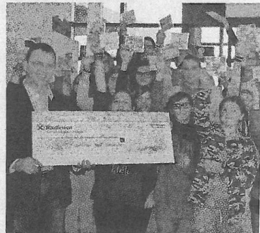
L'assegno del ricavato grazie alla vendita dei cd dei giovani

Gli scolari hanno registrato assieme ai loro insegnanti alcune canzoni su un cd e questo è stato poi messo in vendita. La lodevole azione è stata svolta dai ragazzi con grande entusiasmo. L'Aeb ringrazia tutti i partecipanti per questa generosa donazione.