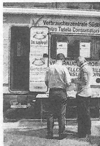
Il camper in un centro altoatesino