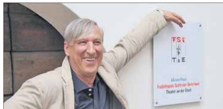
Roland Selva hat das Stück bearbeitet.

Der zeitlose Text veranschaulicht die Gefahren religiöser Intoleranz und verweist auf das Spannungsverhältnis von Glaube und Heimat in einem historischen Kontext, welches gerade heute von erschreckender Aktualität ist. Als Reaktion auf die unter der ländlich-bäuerischen Bevölkerung sich rasant ausbreitenden Anhängerschaft der Reformlehre Luthers, befiehlt ein kaiserliches Edikt die Vertreibung der Protestanten aus dem habsburgischen Reich. Ange-