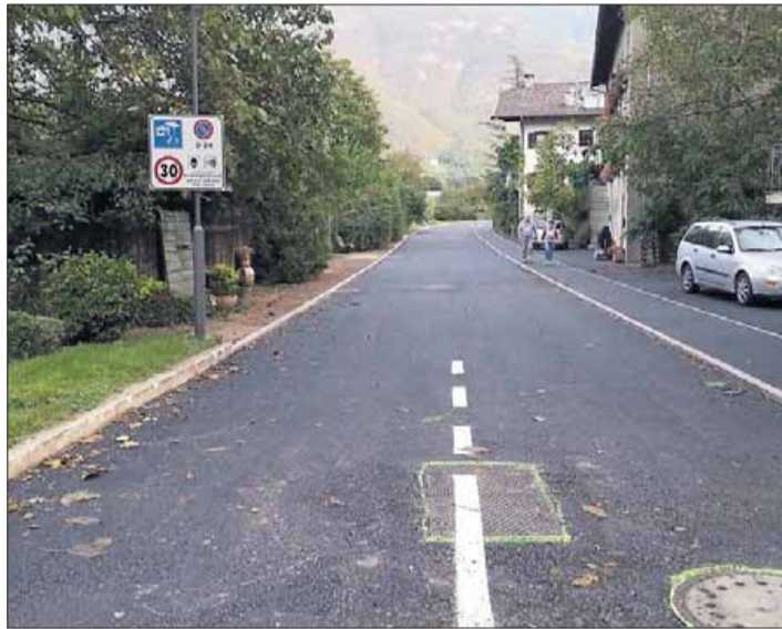
Im Bild der Gartenweg in Kurtinig nach dem Abschluss der Zivilschutzarbeiten, bei denen die Straße um bis zu einem halben Meter erhöht wurde.

KURTINIG. Der Gartenweg liegt auf einer Höhe von 209 Metern und ist somit einer der am tiefsten gelegenen Orte in Kurtinig. Bei Starkregen kam es in der Vergangenheit dort immer wieder zu Überschwemmungen. Nun wurde der Gartenweg um rund einen halben Meter erhöht, um künftig Überschwemmungen zu vermeiden. Die hydrogeologischen Arbeiten wurden jetzt abgeschlossen.