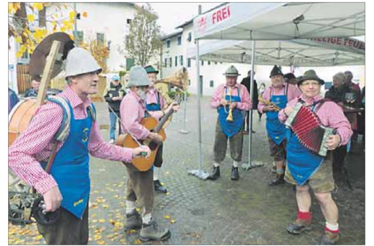
Auch in Kurtinig wurde gestern der beliebte Martinimarkt abgehalten. Für musikalische Unterhaltung sorgte die „Wurzelmusi“ aus Latsch.